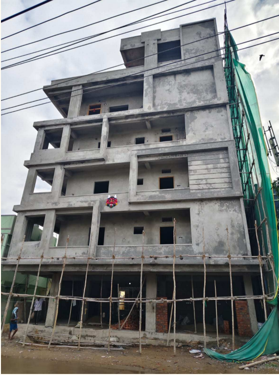
జగద్దిగుట్ట వాల్టర్ వర్వ్ కార్యాలయం ముందు భారీ అక్రమ నిర్మాణం - ప్రజావాణిలో ఫిర్యాదులు సైతం బుట్టదాఖలు