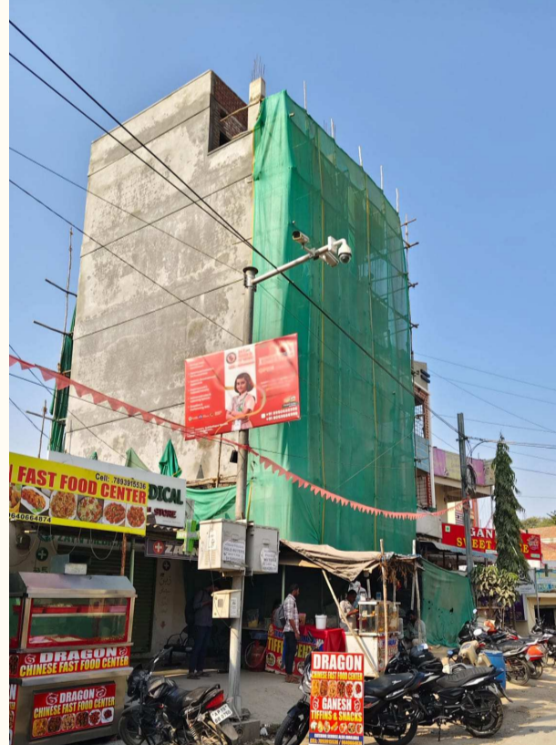
దేవేందర్ నగర్ చౌరస్తా లో భారీ కమర్షియల్ జీరో పర్మిషన్ భవన నిర్మాణం