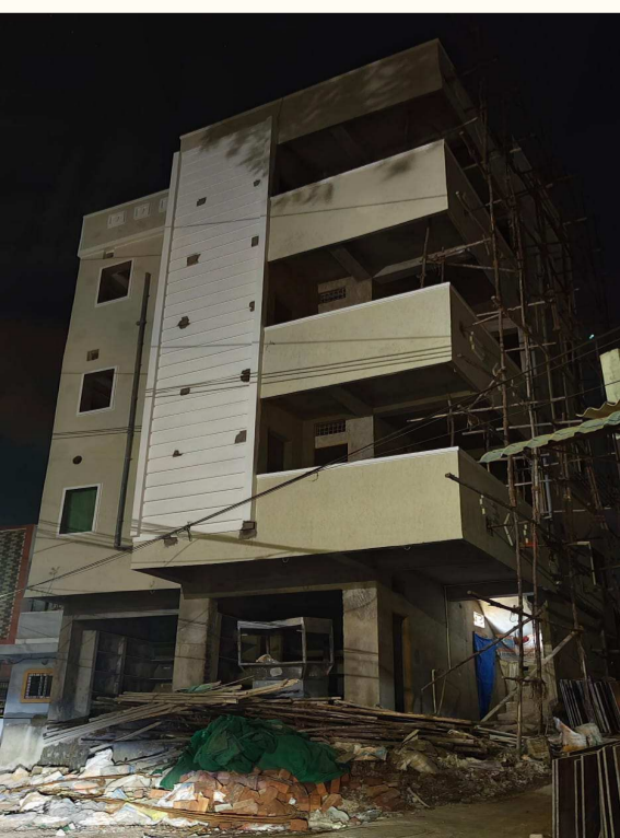
రోడ్మెట్రి నగర్ - బేకర్ గడ్డ మసీదు సమీపంలో నాలుగుంతస్తుల జీరో పర్మిషన్ భవన నిర్మాణం