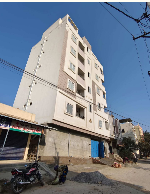
రావి నారాయణ రెడ్డి నగర్, రోడ్ నంబర్ 3 లో వెలిసిన జీరో పర్మిషన్ ఆరంతస్తుల భవన నిర్మాణం