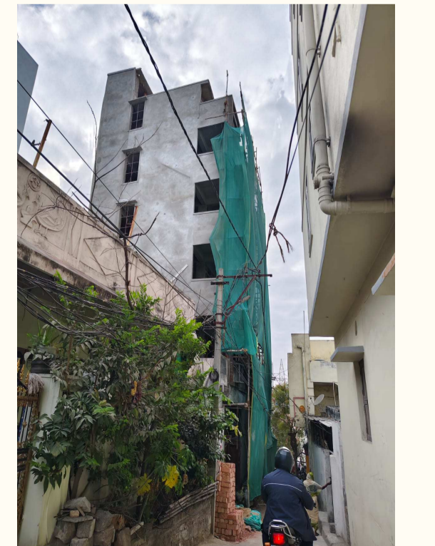
షిరిడి హిల్స్ రోడ్ నంబర్ 18లో వెలుస్తున్న భారీ అక్రమ నిర్మాణం