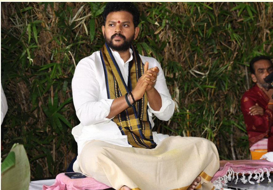
ఉండేలా చూడాలని తెలిపారు. జిల్లాలో చేపట్టిన చర్యల గురించి కేంద్ర మంత్రి రామ్మోహన్