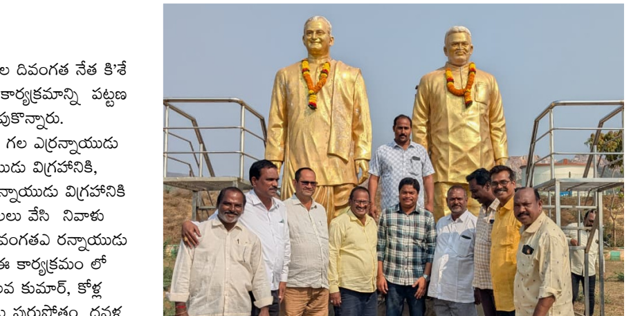
అభిమానులు తదితరులు పాల్గొన్నారు.