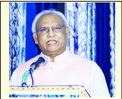
కవి రత్న సాహిత్య ధీర, సహస్ర కవి భూషణ్, పోలయ్య కూకట్లపల్లి, అత్తాపూర్, హైదరాబాద్

ఈమె హృదయంలో పలికే మృదుమధుర సుస్వర గీతంలో నేనిక్కడ..!