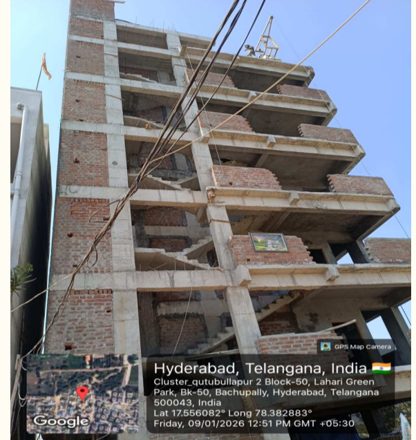
కల్పించుకుని చర్యలు తీసుకుంటే బాగుంటుందని పలువురు అభిప్రాయపడుతున్నారు.

అయ్యాడు. ఇంకేముంది, రెవెన్యూ అధికారులను మసి పూసి మారేడుకాయ చేసినట్టున్నాడు. సదరు అక్రమ నిర్మాణం కాస్త సక్రమం అయ్యింది. అందుకే కదా ఆరు అంతస్తులు ప్లస్ పెంట్ హౌస్ నిర్మాణం విత్ వన్ వాన్ మెన్. ఏకంగా ప్రైవేట్ భూమిలో ఎల్ఆర్ఎస్, బీఆర్ఎస్ కట్టుకుని... సరైన అనుమతులు టౌన్ ప్లానింగ్ నుండి పొందినంత ధీమాగా నిర్మాణాన్ని తుది దశకు తీసుకువచ్చాడంటూ పలు అనుమానాలు వ్యక్తం చేస్తున్నారూ స్థానిక ప్రజలు. ఈ బహుళ అంతస్తుల భవన నిర్మాణం స్థానిక రెవెన్యూ, మున్సిపల్ అధికారులకు కనిపించడం లేదా...? కనిపించినా, చర్చి ఫాదర్ అండ్ వన్ ట్రోకర్ వారిని భయాందోళనకు గురిచేస్తున్నారా...? అనేది తెలియాల్సి ఉంది. ఇక్కడి ప్రభుత్వ భూమి అయినట్టువంటి సర్వే నంబర్ 576లో కేవలం బేస్మెంట్ లు కట్టుకున్నా, రేకుల రూములు ఇండ్లు నిర్మించుకున్నా... వదిలిపెట్టకుండా... కూల్చివేతలు చేస్తారు సంబంధిత అధికారులు. మరి ఇంతపెద్ద అక్రమ నిర్మాణాన్ని ఎలా వదిలిపెట్టారన్న అనుమానాలు సైతం వెల్లువెత్తుతున్నాయి. ఇకనైనా స్థానిక రెవెన్యూ, మున్సిపల్, హైద్రా అధికారులు