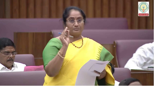
గడిచిందని తెలిపారు. చేనేత వృత్తిలో ఉన్న వారందరూ ఉచిత విద్యుత్ కు అర్హులైనారు. మగ్గం నేసే నేతన్నలకు 200 యూనిట్ల అందజేయబోతున్నామని, దీనివల్ల ఆయా నేతన్నల కుటుంబాలకు నెలకు రూ.720 లు, ఏడాదికి రూ.8,640లు ఆదా కానుందన్నారు. ,