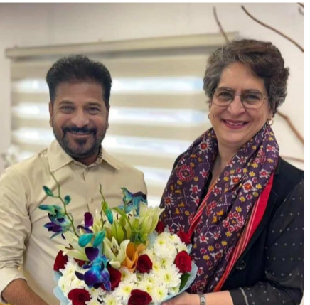
గా ఉన్నారా కాబట్టే.. కాంగ్రెస్ పార్టీకి ఘన విజయం కట్టబెట్టారని ప్రియాంక గాంధీకి తెలియజేశారు సీఎం రేవంత్.

స్వాడిల్లి, నవతరం ఏఐసీసీ జాతీయ ప్రధాన కార్యదర్శి, ఎంపీ ప్రియాంక గాంధీతో సీఎం రేవంత్ రెడ్డి భేటీ అయ్యారు. ఢిల్లీలో శుక్రవారం సాయంత్రం జరిగిన ఈ భేటీలో తెలంగాణ మున్సిపల్ ఎన్నికల ఫలితాలపై చర్చ జరిగినట్లు సమాచారం. మున్సిపల్ ఎన్నికల్లో కాంగ్రెస్ పార్టీ ఘన విజయం సాధించడంపై ప్రియాంక గాంధీ హార్షం వ్యక్తం చేసినట్లు సమాచారం. సీఎం రేవంత్ ను ప్రియాంక ప్రత్యేకంగా అభినందించినట్లు సమాచారం. రాష్ట్ర ప్రభుత్వం అమలు చేస్తున్న సంక్షేమ, అభివృద్ధి కార్యక్రమాలతో ప్రజలు సంతృప్తి