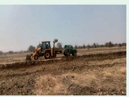
అక్రమ మట్టి తవ్వకాలు

అక్రమ మట్టి తవ్వకాలు టీకాల్, నవతరం: వాల్టా చట్టానికి వ్యతిరేకంగా ప్రభుత్వ భూముల్లో నుంచి మట్టి తవ్వకాలు జరిపి ప్రభుత్వ ఆదాయానికి గండి కొడుతున్న వైనం అల్లారుద్దంలో చోటుచేసుకుంది. మండలంలోని చేపల్ల గ్రామ సమీపంలో ఉన్న ప్రభుత్వ భూముల్లో నుంచి అల్లారుద్దం గ్రామానికి చెందిన వ్యక్తులు అక్రమంగా మట్టి తవ్వకాలు జరిపి తమ సొంత వ్యాపారానికి పార్టీ ఫార్మ్ కు వినియోగించుకుంటున్నారు. ఎలాంటి అనుమతులు లేకుండా ప్రభుత్వ నిబంధనలకు విరుద్ధంగా ఎవరు ప్రవర్తించిన చర్యలు తీసుకుంటామన్న అధికారులు అక్రమ మట్టి తవ్వకాలను చేపడుతున్న వారిపై ఎలాంటి చర్యలు తీసుకుంటారో వేచి చూడాల్సింది..