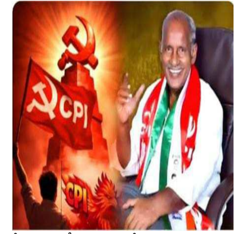
కేవలం 22 సీట్లు గెలుచుకోవడం దురదృష్టకరమని ఈ ప్రాంత ప్రజలు విచారం వ్యక్తం చేస్తున్నారు, కొత్తగూడెం ప్రాంతంలో క్షీణ దశలో ఉన్న బి ఆర్ ఎస్ పార్టీ 8 సీట్లు గెలవడం ఆ పార్టీకి ఎంతో బలాన్ని చేకూర్చింది, కాంగ్రెస్ పార్టీ అండతో బరిలో దింపిన సిపిఐ పార్టీ పోటీ చేసిన రెండు స్థానాల నుండి కేవలం ఒక చీటికి పరిమితమైంది ఎన్నికల్లో ఆ పార్టీ ఉనికి చాటుకున్నదని అంటున్నారు, ఏ ఛాయలు లేని బిజెపి లాంటి పార్టీ ఒక సీటు గెలుచుకోవడం అలాగే (ఇండిపెండెంట్) స్వతంత్ర అభ్యర్థులు ఐదుగురు గెలవడం విరు వి పార్టీలోకి వెళితే ఆ పార్టీకి బలం చేకూరుతుంది ఒకవేళ సిపిఐ బి ఆర్ ఎస్ కలిసి నట్లయితే సిపిఐ మేయర్, బి ఆర్ ఎస్ వైస్ మేయర్ తీసుకునే అవకాశాలు మెండుగా ఉన్నాయని కొత్తగూడెం ప్రాంత ప్రజలు అంటున్నారు, ఏది ఏమైనప్పటికీ జరగబోయే పరిణామాలు కాంగ్రెస్ పార్టీకి పెద్ద దెబ్బల మారాయని భవిష్యత్తులో కమ్యూనిస్టుల చెలిమి కాంగ్రెస్ పార్టీ వీడకూడదని అంటున్నారు, 1975 కాంగ్రెస్ పార్టీ ఇందిరా గాంధీ ఎమ్మెల్యే పెట్టిన సందర్భంలో కాంగ్రెస్ పార్టీ ఉనికి కోల్పోకుండా అండగా నిలిచింది కమ్యూనిస్టు పార్టీ, నాటి భారత కమ్యూనిస్టు పార్టీ జాతీయ కార్యదర్శి డాంగే జాతీయ పార్టీగా ఉన్న సిపిఐ అనేక సందర్భాలలో కాంగ్రెస్ పార్టీ క్షీణ దశలో ఉన్నప్పుడు అండగా నిలిచి ఆ పార్టీకి బలాన్ని చేకూర్చింది