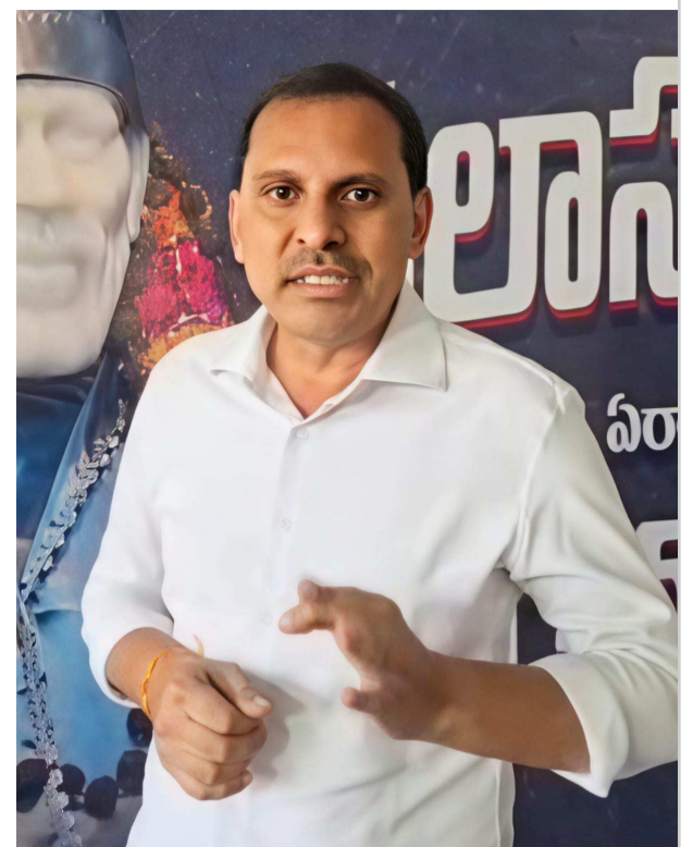
రాష్ట్ర ఉప ముఖ్యమంత్రి పవన్ కళ్యాణ్ కూడా హెచ్చరించారని ఆయన గుర్తు చేశారు. దేశంలో కొందరు ఎమ్మెల్యేలు అక్రమ కట్టడాలను, బెల్ట్ షాపులను స్వయంగా బుల్డోజర్లతో కూల్చివేసి కఠిన నిర్ణయాలు తీసుకున్న దాఖలాలు ఉన్నాయని, మరి పలాస ఎమ్మెల్యే గౌతు శిరీష మధ్యం అధిక ధరలకు విక్రయిస్తున్న మధ్యం సిండికేట్ లపై ఎటువంటి చర్యలు తీసుకుంటారో వేచి చూస్తున్నారు.

అందుబాటులో ఉంటుందని ఆయన తెలిపారు. మధ్యం వ్యాపారంలో ఆరితేరిన ఒక కీలక నేత నిబంధనలకు పాతరే స్తు , దర్జాగా అధిక ధరలకు మధ్యం విక్రయాలు కొనసాగిస్తూ, బెల్ట్ షాపులు విస్తరింపచేస్తూ, ప్రభుత్వ నిబంధనలు తుంగలో తొక్కుతూ, మధ్యం వ్యాపారం అడ్డు అడుపు లేకుండా కొనసాగిస్తున్న తీరు దారుణమన్నారు. కోట్ల రూపాయల వ్యాపారం కొనసాగడంతో ఎక్సైజ్ శాఖ అధికారుల చేతులలో అక్రమంగా లక్షల్లో సొమ్ములు చేతులు మారడంతో అధికారులు ఏమీ పట్టినట్లు వ్యవహరిస్తున్నారని ఆయన ఆరోపించారు. అధిక ధరలకు అమ్మకాలు కొనసాగించడమే కాక వేళా పాల లేకుండా 24 గంటలు విక్రయాలు జరుగుతున్న పలాస సిండికేట్లు ప్రభుత్వం నిర్దేశించిన ఎమ్మార్పీ ధరలను మించి.. క్వార్టర్ పై రూ. 20 నుంచి 30 వరకు అదనంగా పన్నులు చేస్తున్నారని, ఇంతగా మధ్యపాన వినియోగదారుల నుంచి దోపిడీ చేస్తున్నప్పటికీ ఎక్సైజ్ శాఖ అధికారులు లంచాల మత్తులో జోగుతున్నారని ఆయన మండిపడ్డారు. మధ్యం దుకాణంలో ఎంతర్పి కంటే అధిక ధరలకు విక్రయాలు జరిగితే కఠిన చర్యలు తీసుకుంటామని జనసేన అధినేత,