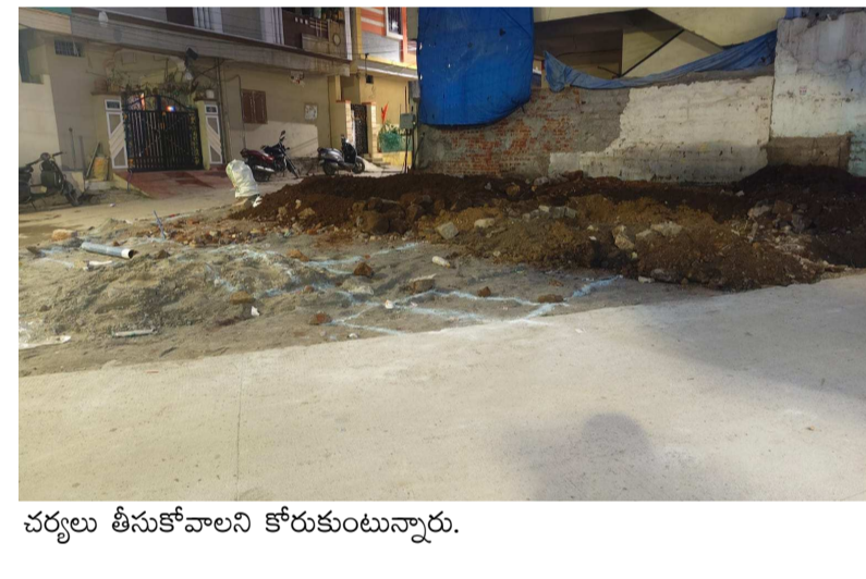
చర్యలు తీసుకోవాలని కోరుకుంటున్నారు.

సంబంధించి స్థానిక ప్రజలు అభ్యంతరం వ్యక్తం చేసినందుకు పట్టణం తీసిన గుంతలను గతంలో పూడ్చివేశారు. కొందరు దళారులను అడ్డం పెట్టుకుని స్థానిక రెవెన్యూ, టౌన్ ప్లానింగ్ అధికారులను వెర్రివాళ్ళను చేశారు. తర్వాత అనుకున్నట్టు అన్నీ జరిగేసరికి అంతా అనుకున్నట్టుగా మళ్ళీ మొదటినుండి నిర్మాణపనులు చేపట్టి ఇప్పటికే జీ ప్లాన్ వన్ భవన నిర్మాణం చేపట్టాడు. సదరు అక్రమ నిర్మాణంపై వార్తా కథనాలు విలువదినా, స్థానికులు సోషల్ మీడియా (ఎక్స్) వేదికగా ఫిర్యాదులు చేసినా తమకు పట్టనట్టుగా వ్యవహరిస్తున్నారు. చట్టపరమైన చర్యలు తీసుకుని పబ్లిక్ ప్రాసెస్ ని కాపాడాల్సింది పోయి మిన్నకుంటున్నారు. అందుకు ఎన్ని కారణాలున్నా సదరు విషయంపై టౌన్ ప్లానింగ్ అధికారులు, రెవెన్యూ అండ్ ఎలక్ట్రిసిటీ అధికారులు స్పందించి చర్యలు తీసుకోవాలని స్థానికులు కోరుకుంటున్నారు. ఇదే విషయమై స్థానిక విలేజరులు ఇల్లీగల్ భవన నిర్మాణం విషయంలో వార్తలు రాస్తుంటే... అక్కడే కాపు కాచుకుని కూర్చున్న ఓ వ్యక్తి వారిని ఫోటోలు తీసి భయాందోళనకు గురిచేస్తున్నాడు. ఇదే విషయమై అత్రగాడిపై కూడా