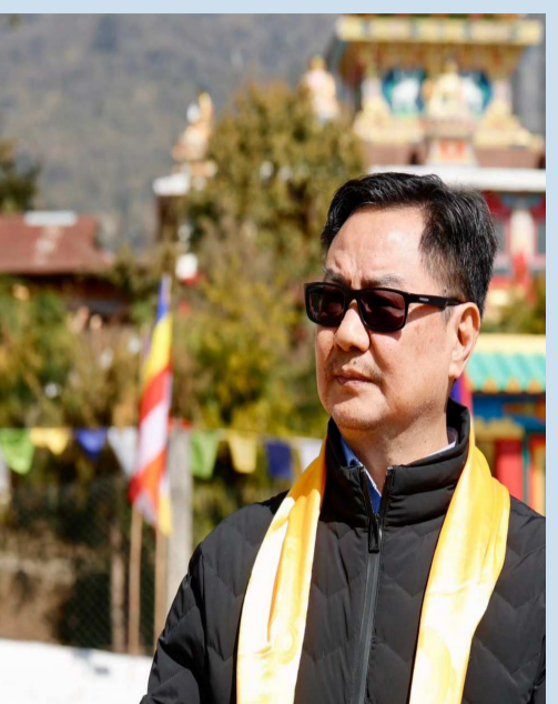
నిషేధం విధించాలని కోరారు. ఈ నేపథ్యంలో రాహుల్ పై కిరణ్ రిజిజు తాజా వ్యాఖ్యలు చేయడం గమనార్హం.

అన్నారు. దేశ చరిత్రలో ఎప్పుడూ ఆయనలాంటి ప్రతిపక్ష నేతను చూడలేదని రిజిజు విమర్శించారు. పార్లమెంట్ సమావేశాలు జరగనియకూడదనే ఉద్దేశంతో కాగితాలు విసిరేయడం, నినాదాలు చేస్తూ వాక్ ఓట్ చేయడం వంటి చిన్న పిల్లల చర్యలు చేస్తుంటారని అసహనం వ్యక్తంచేశారు. రాహుల్ గాంధీ ఇలా సభకు అంతరాయం కలిగించడంవల్ల ప్రజల సమస్యల గురించి మాట్లాడాలనుకునే వారికి అవకాశం దక్కబోదని చెప్పారు. అమెరికా ప్రభుత్వానికి భారత్ తలొగ్గిందని, జాతీయ ప్రయోజనాలతో రాజీ పడుతోందని ఇటీవల లోక్ సభలో రాహుల్ ఆరోపించారు. అయితే రాహుల్ తన వ్యాఖ్యలతో దేశాన్ని తప్పదారి పట్టిస్తున్నారని బీజేపీ పార్లమెంట్ సభ్యుడు నిఖిలాంత్ దూబే విమర్శించారు. ఫిబ్రవరి 12న లోక్ సభలో రాహుల్ కు వ్యతిరేకంగా తీర్మానాన్ని ప్రవేశపెట్టారు. రాహుల్ పార్లమెంటు సభ్యత్వాన్ని రద్దు చేయాలని, ఎన్నికల్లో పోటీ చేయకుండా జీవితకాల