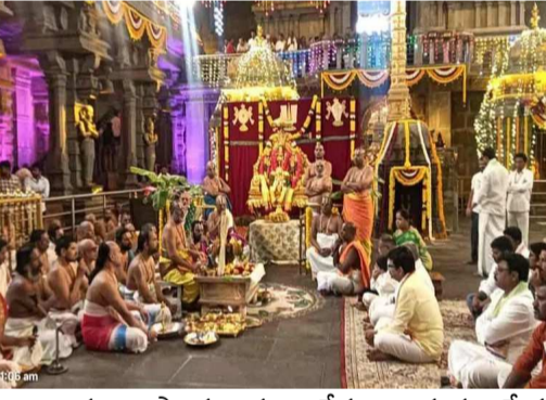
అలంకారం, సాయంత్రం శేష వాహన సేవ వేదపారాయణములు. రాత్రి 7 గంటలకు శేష వాహన సేవ, 21 న ఉదయం వటపత్రకాయ అలంకార సేవ, రాత్రి హంసవాహన సేవ, 22 న శ్రీ కృష్ణాలంకార సేవ, ధారి, సాయంత్రం సింహ వాహన సేవ ఉంటుంది. 24న జగన్మోహినీ అలంకార సేవ, అశ్వ వాహనం పై రాత్రి ఎదుర్కొలు వేడుక చేస్తారు.