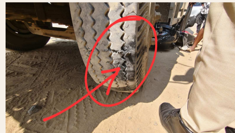
ముందు టైర్ ఎక్కిన తర్వాత వెనుక టైర్ ముందుకు పడిపోయిన పల్లర్ వాహనం