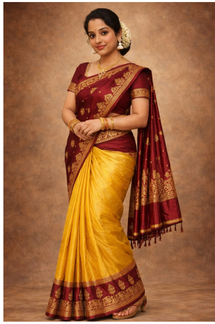
ఇదిగో చిత్రం తిలకించండి ఈమె మన సాంప్రదాయ సాందర్యానికిది ప్రతిరూపం

బంగారు ఆభరణాలతో అందాలతో ఆమె ఒక అతిలోక సుందరి ఆమె ఒక అజంతా శిల్పం