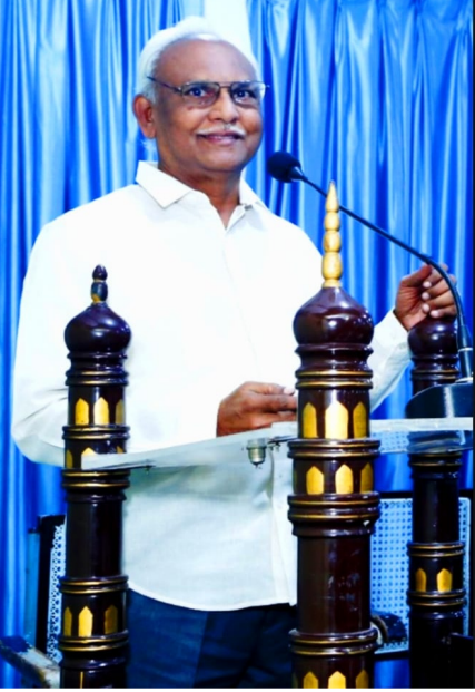
హైదరాబాద్ :బాగ్ లింగంపల్లి