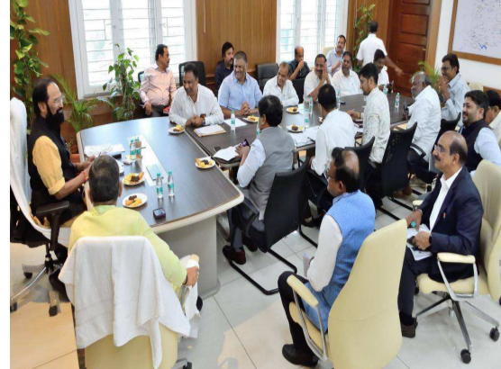
హామీ ఇచ్చారు. రాష్ట్రంలో గ్యాస్ పంపిణీ సక్రమంగా జరిగేలా చూడటంతో పాటు, అక్రమ నిల్వలను అరికట్టేందుకు రాష్ట్ర, జిల్లా స్థాయి కమిటీలను ఏర్పాటు చేసినట్లు మంత్రి తెలిపారు. గృహ అవసరాల సిలిండర్లు పక్కదారి పట్టకుండా కఠిన చర్యలు తీసుకుంటామని ఆయన హెచ్చరించారు. మొత్తానికి, సామాన్యుడి వంటింట్లో మంట ఆరిపోకుండా ప్రభుత్వం అన్ని జాగ్రత్తలు తీసుకుంటోందని ఆయన భరోసా ఇచ్చారు.

రాష్ట్రవ్యాప్తంగా 1.3 కోట్ల మంది యాక్టివ్ గృహ వినియోగదారులు ఉన్నారని, వారికి సరిపడా సిలిండర్లను అయిల్ కంపెనీలు అందిస్తున్నాయని మంత్రి తెలిపారు. గతంలో రోజుకు సగటున 2.15 లక్షల సిలిండర్లు సరఫరా అయ్యేవని, ప్రస్తుత డిమాండ్ ను బట్టి దానిని 2.3 లక్షలకు పెంచినట్లు అయిన వెల్లడించారు. గ్యాస్ కొరత ఉందన్న ఆందోళనతో వినియోగదారులు అవసరంగా ఓవర్ బుకింగ్ చేసి సిస్టమ్ ను ఓవర్లోడ్ చేయవద్దని ఆయన విజ్ఞప్తి చేశారు. హోటళ్లు, ఇతర వ్యాపార సంస్థలు వాడే 19 కేజీల కమర్షియల్ సిలిండర్ల సరఫరాలో మాత్రం తగ్గుదల ఉన్న మాట వాస్తవమేనని మంత్రి అంగీకరించారు. కేంద్ర ప్రభుత్వం నిర్దేశించిన కొత్త మార్గదర్శకాల వల్ల గతంలో ఉన్న సరఫరాలో కేవలం 20 శాతం మాత్రమే ప్రస్తుతం అందుబాటులో ఉందని ఆయన వివరించారు. గతంలో రోజుకు 23,000 కమర్షియల్ సిలిండర్లు సరఫరా అయ్యే చోట, ఇప్పుడు కేవలం 6,200 మాత్రమే వస్తున్నాయని, ఈ సమస్యను పరిష్కరించేందుకు కేంద్ర ప్రభుత్వంతో చర్చలు జరుపుతామని ఆయన