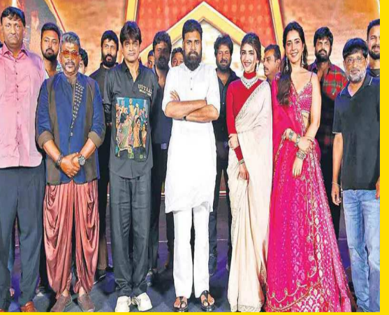
సినిమాకోసం తను పడ్డ తపన సామాన్యమైంది కాదు. ఈ సినిమాని అందరూ మెచ్చాలా తను తీర్చిదిద్దారు.

దర్శకత్వంలో మైత్రీ మూవీమేకర్స్ పతాకంపై నవీన్ యర్నేని, యలమంచిలి రవిశంకర్ ఈ చిత్రాన్ని నిర్మించారు. ఈ నెల 19న సినిమా విడుదల కానుంది. ఈ సందర్భంగా ఆదివారం హైదరాబాద్ లో ఏర్పాటు చేసిన ప్రీవీజ్ ఈవెంట్ లో పవన్ కల్యాణ్ మాట్లాడారు. ఇంకా చెబుతూ 'ఈ సినిమా బాగా రావడానికి కారణం హరీశ్ శంకర్. నా కాలం తాలూకు విలువను అర్థం చేసుకొని నన్ను ముందుకు నడిపించాడు తను. 45రోజుల్లో సినిమా పూర్తి చేశాడు. సినిమాలు చేయాలా వద్దా అనే మీమాంసలో ఉన్న నాకు, ఈ ఫ్లానింగ్ తో ముందుకెళ్లే సినిమాలు చేయొచ్చని నమ్మకాన్ని, ధైర్యాన్ని ఇచ్చాడు. తను తెలంగాణ బిడ్డ. కరీంనగర్ నుంచి వచ్చిన వ్యక్తి. అద్భుతమైన పాండిత్యం గల గొప్ప దర్శకుడు. ఈ