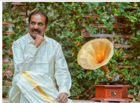
ఎంపికైన వైరముత్తుకు తమిళనాడు ముఖ్యమంత్రి ఎం.కె.స్టాలిన్ అభినందనలు తెలిపారు. 'తన కవితా పటిమతో తమిళ భాషను శాసిస్తున్న 'కవిపీఠరస' (కవి సామ్రాట్) వైరముత్తుకు జ్ఞానపీఠ పురస్కారం దక్కింది. ఈ రోజే నేను వైరముత్తును కలిసి మాట్లాడాను. ఆ భేటీ ముగిసిన కొద్దిసేపటికే ఈ తీపి కబురు రావడం ఆ సంతోషాన్ని మరింత రెట్టింపు చేసింది' అని ఎన్టీలో పోస్టు పెట్టారు.

గేయరచయితగా తమిళ చిత్ర పరిశ్రమకు పరిచయమయ్యారు. కవితలు, నవలలు తదితర సుమారు 40 పుస్తకాలు, సినీమాలో సుమారు 7,500 పాటలు రాశారు. ఇప్పటికే ఆయన సాహిత్య అకాడమీ, సాధన సమ్మాన్, పద్మశ్రీ, పద్మభూషణ్ వంటి ప్రతిష్టాత్మక పురస్కారాలు అందుకున్నారు. ఉత్తమ గేయ రచయితగా 7 సార్లు జాతీయ పురస్కారాలు అందుకున్న ఏకైక రచయిత ఆయన మాత్రమే. ఉత్తమ గేయ రచయితగా రాష్ట్ర ప్రభుత్వం నుంచి 6 సార్లు పురస్కారాలు అందుకున్నారు. జ్ఞానపీఠ పురస్కారాన్ని ఇప్పటికే రాష్ట్రానికి చెందిన అఖిలన్ (1975), జయకాంతన్ (2002) అందుకోవడం గమనార్హం. జ్ఞానపీఠ అవార్డుకు