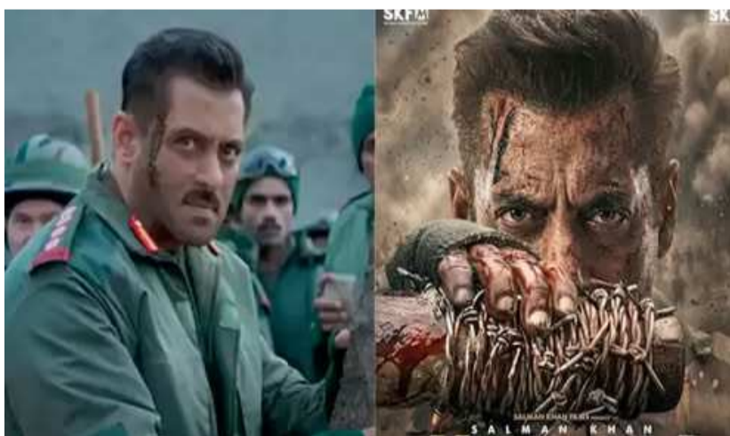
అవకాశాలు కనిపిస్తున్నాయి. ఆగస్టులో దీన్ని ప్రేక్షకుల ముందుకు తీసుకురానున్నట్లు సమాచారం.

అధికారిక మీడియా అక్కసు వెళ్లగక్కింది. చైనాపై వ్యతిరేకతను రెచ్చగొట్టేందుకు చరిత్రను వక్రీకరిస్తున్నారంటూ నోరు పారేసుకుంది. ఈ చిత్రం జాతీయవాద మెలోడ్రామా అని చైనా ఆరోపించింది. ఈ పరిణామాల వేళ తాజాగా సినిమా పేరును మార్చడం గమనార్హం. వాస్తవానికి ఈ చిత్రాన్ని ఏప్రిల్ 17న విడుదల చేయనున్నట్లు తొలుత వార్తలు వచ్చాయి. ఇప్పుడు పేరు మార్పుతో దీని విడుదల మరింత ఆలస్యమయ్యే