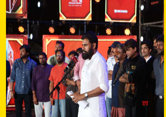
అందరినీ ఆకట్టుకుంది. 'ఉస్మాద్ భగత్ సింగ్' చిత్రం 2026 మార్చి 19న ప్రపంచవ్యాప్తంగా గ్రాండ్ గా విడుదల కానుంది.

పవన్ కళ్యాణ్ ఫోటోతో పాటు ఆయన సినిమాల్లోని పవర్ ఫుల్ డైలాగులను గుర్తు చేసే గ్రాఫిక్స్ ఉండటం అభిమానులను ఆకట్టుకుంది. ఈ ప్రత్యేకమైన షర్ట్ చూసిన అభిమానులు సోషల్ మీడియాలో విపరీతంగా స్పందిస్తున్నారు. హరీష్ శంకర్ తన స్టైల్ తో పవన్ స్టార్ మాస్ మేనియాను కొత్తగా చూపించారని అభిమానులు కామెంట్లు చేస్తున్నారు. ప్రస్తుతం ఈ షర్ట్ ఫోటోలు సోషల్ మీడియాలో వైరల్ అవుతున్నాయి. మరోవైపు పవన్ కళ్యాణ్ ఈ వేడుకలో తనదైన సింప్లిసిటీతో అభిమానుల మనసు గెలుచుకున్నారు. భారీ అంచనాలు ఉన్న సినిమా కార్యక్రమం అయినప్పటికీ, ఆయన చాలా సాధారణంగా వైట్ కుర్తా ధరించి ఈ ఈవెంట్ కు హాజరయ్యారు. రాజకీయాల్లో ఎంత బిజీగా ఉన్నా అభిమానులపై ఆయన చూపించే ఆత్మీయత మరోసారి