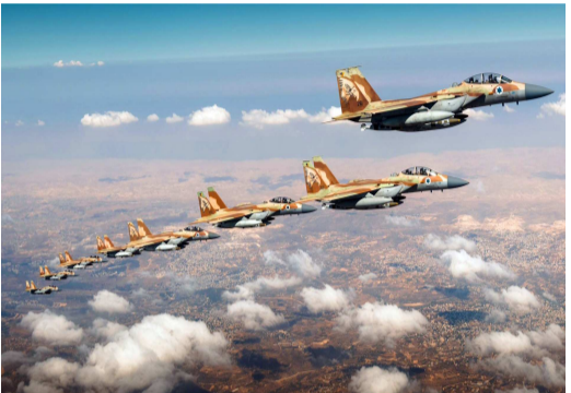
వాటిల్లలేదని వార్తా సంస్థలు తెలిపాయి. ఈ దాడిని ఇరాన్ తీవ్రంగా ఖండించింది. ఇజ్రాయెల్ నేరపూరిత చర్యల్లో భాగంగానే ఈ దాడి జరిపిందని, అణుభద్రతా నిబంధనలు, అంతర్జాతీయ చట్టాలకు తూట్లు పొడిచిందని నిప్పులు చెరిగింది.

వెల్లడించలేదు. కాగా, ఇరాన్ గగనతలంపై ఇజ్రాయెల్ విమానంపై క్షిపణి ప్రయోగం జరిగిందని, అయితే విమాన సిబ్బంది ప్రామాణిక విధానాలను అనుసరించడం ద్వారా ముప్పును తప్పించారని, ఎలాంటి నష్టం లేకుండా మిషన్ ను పూర్తి చేశారని 'ది టైమ్స్ ఆఫ్ ఇజ్రాయెల్' పేర్కొంది. ఇరాన్ క్షిపణి అతి సమీపానికి రావడంతో పైలట్ వృత్తివరమైన నైపుణ్యంతో అత్యంత వేగంగా స్పందించి దాడిని తప్పించినట్లు ఆ కథనం పేర్కొంది. విమానానికి నష్టం జరిగినట్లు ఎలాంటి సమాచారం లేదు. కాగా, ఇరాన్ లోని నతాంజ్ అణుశక్తి కేంద్రంపై ఇటీవల దాడులు జరిపిన అమెరికా-ఇజ్రాయెల్ దళాలు శనివారంనాడు మరోసారి విరుచుకుపడ్డాయి. ఈ దాడుల్లో ఎలాంటి రేడియోధార్మిక పదార్థాలు లీక్ అవుతున్నాయో, పరిసర ప్రాంత నివాసితులకు ప్రమాదం