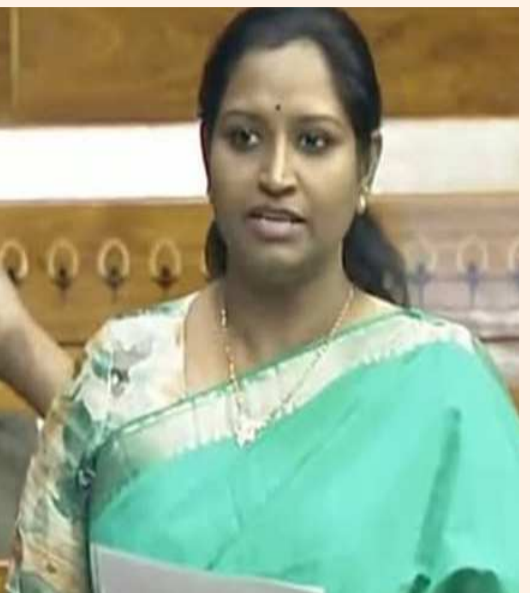
సురక్షితమైన ప్రత్యామ్నాయాలను రైతులకు అందుబాటులోకి తీసుకురావాలని.. ఈ దిశగా ప్రభుత్వం అవగాహన కార్యక్రమాలు చేపట్టాలని ఆమె కోరారు.

సేవించిన వారు ప్రాణాలు కోల్పోతున్నారని ఆమె పేర్కొన్నారు. పారాక్వాట్ సేవించిన సందర్భాల్లో మరణాల రేటు దాదాపు 100 శాతం ఉండటం అత్యంత భయానకమైన విషయం. దీనికి ఇప్పటివరకు ఎటువంటి విరుగుడు అందుబాటులో లేకపోవడం వల్ల ఆసుపత్రికి చేరినా ప్రాణాలు కాపాడటం అసాధ్యంగా మారుతోందని ఆమె ఆవేదన వ్యక్తం చేశారు. వరంగల్ సహా తెలంగాణలోని అనేక జిల్లాల్లో పారాక్వాట్ వల్ల జరుగుతున్న ప్రాణనష్టాన్ని ఎంపీ వివరించారు. ఇండియన్ మెడికల్ అసోసియేషన్, పలువురు వైద్య నిపుణులు కూడా ఈ రసాయనం వల్ల కలిగే ముప్పును గుర్తించి, దీనిపై నిషేధం విధించాలని ఇప్పటికే గళమెత్తారు. ప్రజల ప్రాణాలను కాపాడటం కంటే వేరే ఏదీ ముఖ్యం కాదని, అందుకే కేంద్ర ప్రభుత్వం తక్షణమే దీని తయారీ, అమ్మకాలు, వినియోగంపై సంపూర్ణ నిషేధం విధించాలని ఆమె డిమాండ్ చేశారు. ప్రమాదకరమైన ఇటువంటి రసాయనాలకు బదులుగా పర్యావరణహితమైన,