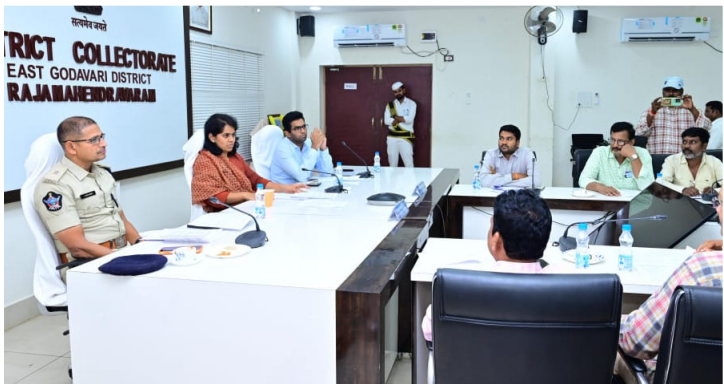
వారధిగా మీడియా ప్రతినిధులు వ్యవహరిస్తూ జిల్లా అభివృద్ధికి తమ విలువైన సూచనలు, సలహాలు అందిస్తూ స్వచ్ఛంద భాగస్వామ్యం కావాలని కలెక్టర్ ఆకాంక్షించారు. రానున్న ఏడాది జరిగే గోదావరి