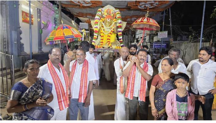
గరుడ వాహనంపై స్వామివారి ఊరేగింపు...

(నవతరం - ఆత్మయోగం) కానసీమ తిరుమల వాడపల్లి శ్రీ వేంకటేశ్వర స్వామి వారి ఆలయంలో ఆధ్యయోగోత్సవాలు రెండవ రోజు ఘనంగా నిర్వహించారు. ఉదయం ఆలయంలో తీర్థ బిందె నదీజలాల సేకరణ కార్యక్రమంతో ఉత్సవాలు ప్రారంభమయ్యాయి. అనంతరం శ్రీ వేంకటేశ్వర స్వామి సహిత లక్ష్మీ హోమం నిర్వహించారు. తరువాత నిత్యసేవాకాలం దివ్యప్రబంధ పారాయణం భక్తిశ్రద్ధలతో జరిగింది. సాయంత్రం స్వామివారి గ్రామోత్సవం