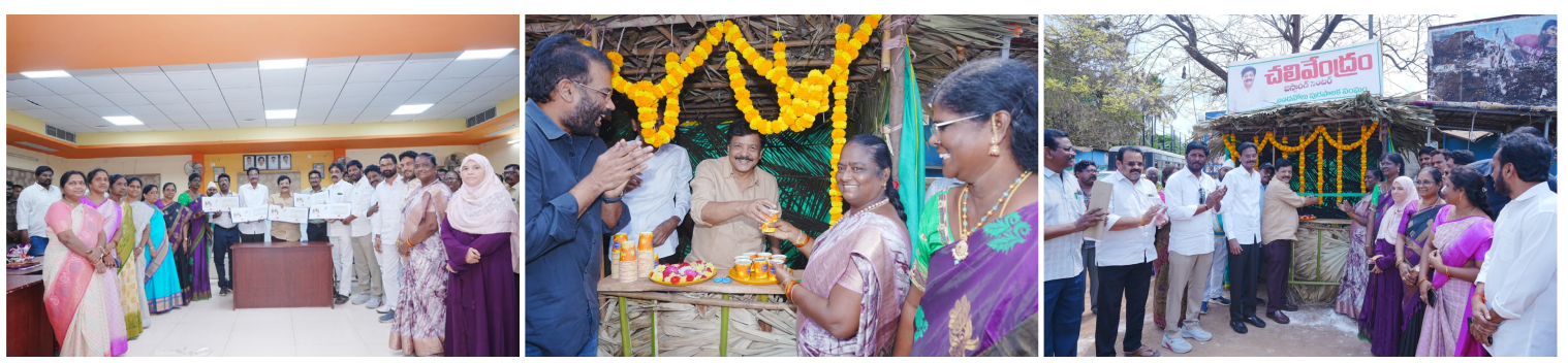
అభివృద్ధికి చిరునామాగా నిదదవోలు: మంత్రి