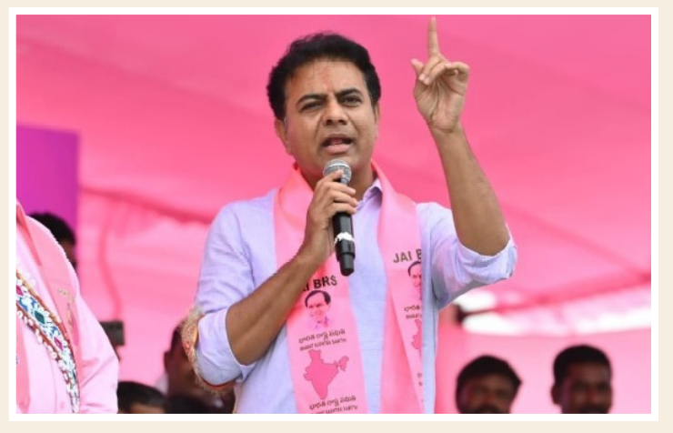
ప్రసంగంలో ప్రభుత్వానికి ఉండాలిని కనిపించలేదని ఎద్దేవా చేశారు. స్పష్టత, విశ్వసనీయత ఏమాత్రం

ప్రత్యేక విచారణ బృందాన్ని (సీట్) ఏర్పాటు చేయాలని డిమాండ్ చేశారు. ఈ ఆరు గ్యాసెట్లకు చట్టబద్ధత కల్పించాలంటూ బీఆర్ఎస్ తరపున అసెంబ్లీలో 'ప్రెవేట్ మెంబర్ బిల్' ప్రవేశపెడతామని ఈ సందర్భంగా ఆయన స్పష్టం చేశారు. "పదవులు ఎవరికీ శాశ్వతం కాదు. పదేళ్లు అధికారంలో ఉన్న మేము ఇప్పుడు ప్రతిపక్ష స్థానంలో ఉన్నాం. నేనే రాజు, నేనే మంత్రి అని మిడిమిడివద్ద వారు శాశ్వతంగా అదే స్థానంలో ఉండరు" అంటూ కేటీఆర్ చరకలు అంటించారు. ఇచ్చిన మాట నిలబెట్టుకున్నప్పుడే పాలకులకు విలువ ఉంటుందని... నిన్నటి గవర్నర్