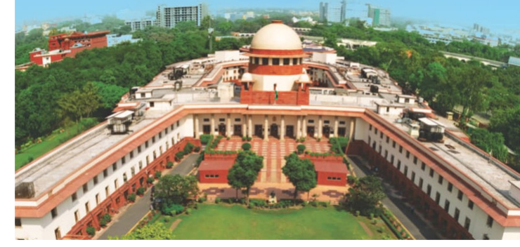
దేశంలో ఎలాంటి ప్రత్యేక చట్టం లేదు. తాజా తీర్పుతో దత్తత తీసుకున్న పిల్లల వయసుతో సంబంధం లేకుండా తల్లులు పూర్తి ప్రసూతి ప్రయోజనాలు పొందేందుకు మార్గం సుగమమైంది.

ప్రభుత్వ విధాన పరిధిలోకి వస్తాయని చెబుతూనే, దీనిపై ఒక స్పష్టమైన చట్టపరమైన ఫ్రేమ్వర్క్ అవసరాన్ని నొక్కి చెప్పింది. దత్తత తీసుకున్న తల్లులకు 12 వారాల ప్రసూతి సెలవులను పరిమితం చేస్తూ 2017లో 'మెటర్నిటీ బెనిఫిట్ యాక్ట్, 1961'లో చేసిన సవరణను సవాల్ చేస్తూ దాఖలైన ప్రజా ప్రయోజన వ్యాజ్యం గ్రాంట్ పై విచారణ సందర్భంగా సుప్రీంకోర్టు ఈ తీర్పు ఇచ్చింది. ప్రస్తుతం అర్హులైన మహిళలకు 26 వారాల వేతనంతో కూడిన ప్రసూతి సెలవులు అందుబాటులో ఉండగా, పితృత్వ సెలవులకు సంబంధించి