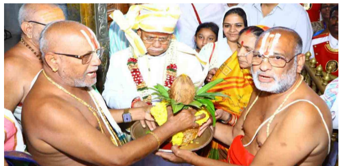
గవర్నర్ శుక్లా దంపతులకు ఘన స్వాగతం దర్శనం చేయించి, వేదాశీర్వాచనం ఇచ్చిన పండితులు