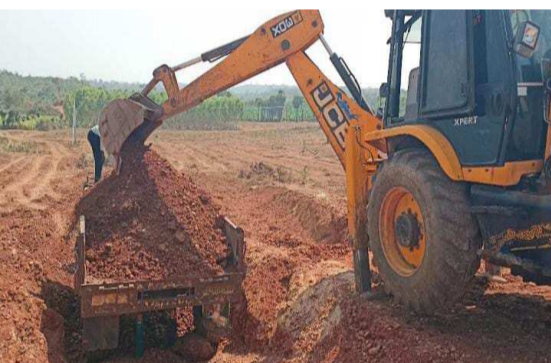
అధికారులపై కఠిన చర్యలు తీసుకోవాలని 'నవతరం' డిమాండ్ చేస్తోంది.

నేటి ప్రశ్న: అధికార బలంతో ప్రశ్నించిన దోచుకుంటుంటే అధికారులు ఎందుకు మౌనంగా ఉన్నారు? ఇది పండుగ సెలవా? లేక అక్రమార్కులకు ఇచ్చిన లైసెన్సా?