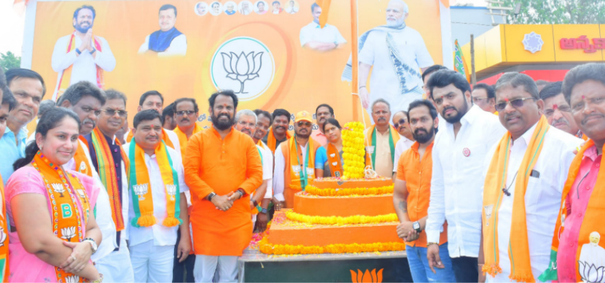
పేర్కొన్నారు. కేంద్ర ప్రభుత్వం చేపట్టిన అభివృద్ధి, సంక్షేమ పథకాలను ప్రజల్లోకి తీసుకెళ్లాలని విలుపునిచ్చారు. పార్టీ కార్యకర్తలు, ప్రజలు పెద్ద సంఖ్యలో పాల్గొన్నారు.