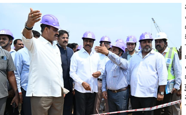
ఈ ప్రాజెక్టులో బ్రేక్ వాటర్, డ్రెడ్జింగ్, బెర్త్ నిర్మాణ పనులు గణనీయంగా పూర్తయ్యాయని

నవతరం-శ్రీకాకుళం మూలపేట గ్రీన్ ఫీల్డ్ పోర్టు నిర్మాణ పనులు శరవేగంగా సాగుతూ ఇప్పటికే సుమారు 70 శాతం పూర్తయ్యాయని రాష్ట్ర మంత్రి బి.సి. జనార్దన్ రెడ్డి తెలిపారు. వ్యవసాయ మంత్రి అచ్చెన్నాయుడుతో కలిసి సోమవారం ఆయన పోర్టు పనులను పరిశీలించారు. అధికారులతో సమీక్ష నిర్వహించిన మంత్రులు, పనులను వేగవంతం చేసి ఈ ఏడాది చివరినాటికి పోర్టు ఆపరేషన్ ప్రారంభించాలనే లక్ష్యంతో ముందుకు సాగుతున్నట్లు తెలిపారు. రూ. 4,361 కోట్ల అంచనా వ్యయంతో చేపట్టిన