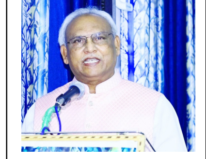
కవి రత్న సాహిత్య ధీర, సహస్ర కవి భూషణ్, పోలయ్య కూకట్లపల్లి, అత్తాపూర్, హైదరాబాద్