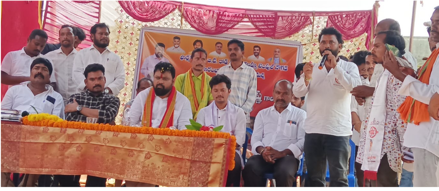
ప్రస్తుతం మంచి ప్రభుత్వం కొనసాగుతోందని ఆయన అన్నారు.