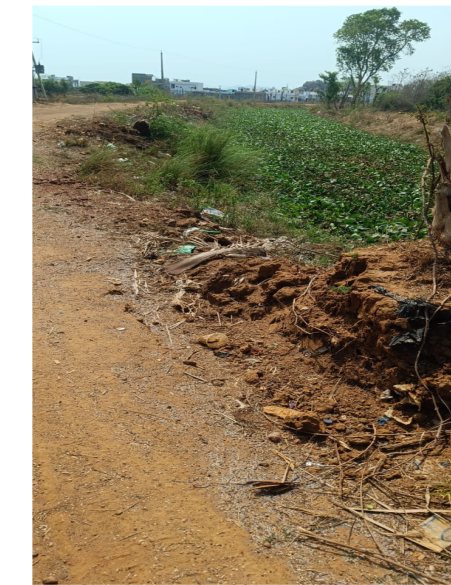
(నవతరం - టెక్నాలి)

చోద్యం చూస్తున్న ప్రతిపక్ష వర్గాలు రైతు కష్టాలు తీరేది ఎప్పుడు అని ఆవేదనతో నిరీక్షిస్తున్న రైతన్న నవతరం టెక్నాలి. శ్రీకాకుళం జిల్లా టెక్నాలి మండల పరిధిలోగల వంశధార పరివాహక పరిసర ప్రాంతంలో గల రైతులు యావన్నుంది వంశధార కాలువ దుస్థితిని చూసి చాలా దయానీయంగా ఆందోళనలో చెందుతున్నారు. ముఖ్యముగా టెక్నాలి మండల పరిధిలో ప్రధానంగా వంశధార నది 48 ఆర్ ప్రధాన కాలువ మరియు