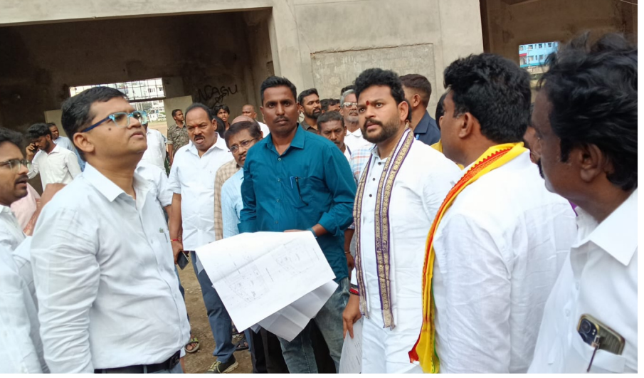
కేంద్ర మంత్రి రామ్మోహన్ నాయుడు 3లో