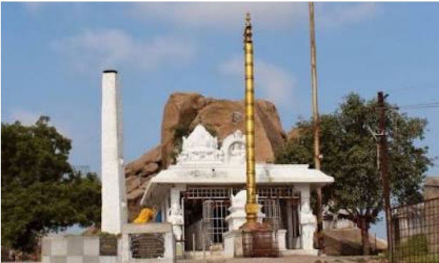
రాజస్థాన్ సిరిసిల్లా జిల్లా తెలంగాణ రాష్ట్రం

ఓ మహారాణి శాపం కారణంగా 600 సంవత్సరాలకు పైగా చరిత్ర కలిగిన దేవాలయం చరిత్ర పుటల్లో నిలిచిపోయింది. గతంలో ఉమ్మడి కరీంనగర్ జిల్లా కేంద్రంలో ఉన్న శ్రీ లక్ష్మీ సమేత నరసింహస్వామి వారు కొలువైన దివ్య క్షేత్రం నాంపల్లి గుట్ట ఇప్పుడు రాజస్థాన్ సిరిసిల్లా జిల్లా కేంద్రంలో ఉంది. ఈ ఆలయాన్ని ఆరు వందల సంవత్సరాల క్రితం చోళులు నిర్మించారని ఆలయ స్థలపురాణం చెబుతోంది. ప్రకృతి సౌందర్యముతో ఆధ్యాత్మికతతో అలారారుతున్న ఈ దేవాలయం కుంకుమ రంగు పాము ఆకారంలో నిర్మించబడింది. ఇది తెలంగాణలోని అతిపెద్ద పాము ఆకారం ఆలయంగా గుర్తింపు పొందిన ప్రసిద్ధ, నరసింహ స్వామి స్వయంభుగా వెలిసిన దేవాలయం. సందర్శకులు పాము పొట్టు ఆకారంలో ఉండే సుదీర్ఘమైన సారంగం మార్గం ద్వారా భక్తులు గుడిలోకి వెళ్లి స్వామి వారిని దర్శించుకుంటారు. ఈ పాడవైన సారంగ మార్గంలో ప్రహారీలు మరెవరి హిరణ్యకశిపుని కథలు తెలిపే విగ్రహాలు ఉన్నాయి. సారంగం చివరన హిరణ్యకశిపుడనే రాక్షసుడిని సహకరించిన నరసింహుని విగ్రహం