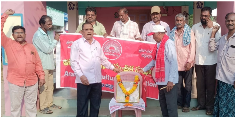
కళాకారులు ప్రజల పక్షాన నిలబడి సామాజిక సమస్యలపై స్పందించాలని పిలుపునిచ్చారు. కార్యక్రమంలో వివిధ సంఘాల నాయకులు పాల్గొన్నారు.