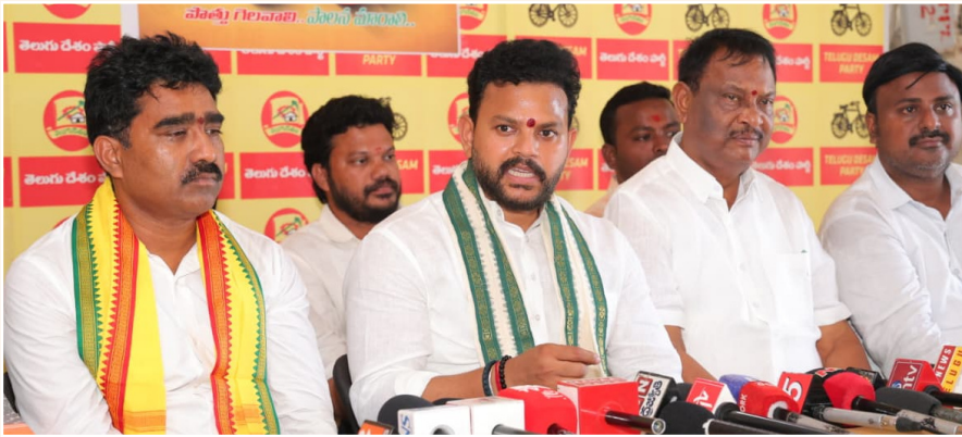
ప్రయత్నాలు చేస్తున్నామని తెలిపారు. పెండింగ్ ప్రాజెక్టులను పూర్తి చేసి కొత్త పనులను ప్రారంభించడం ప్రభుత్వ లక్ష్యమని, ప్రాంతీయ అభివృద్ధికి కట్టుబడి ఉన్నామని స్పష్టం చేశారు.