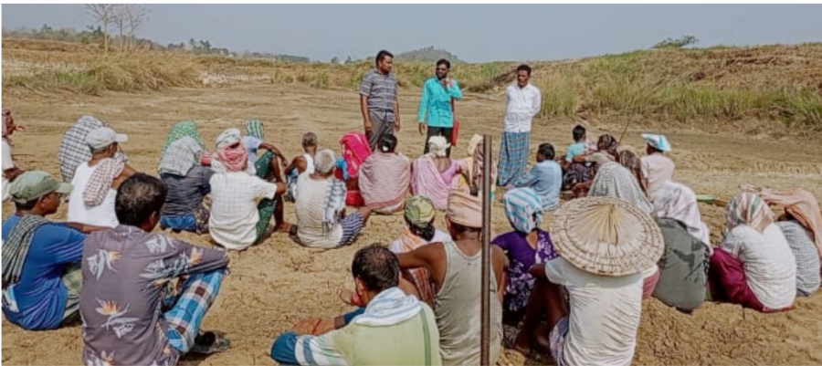
రూ. 600 కూలి, పాత విధానాల పునరుద్ధరణతో పాటు ప్రాథమిక సౌకర్యాలు కల్పించాలని డిమాండ్ చేశారు. కార్యక్రమంలో నాయకులు, కూలీలు పాల్గొన్నారు.