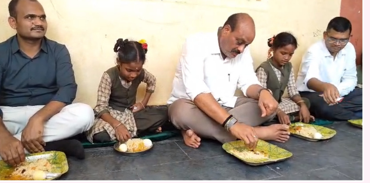
నవతరం - బెక్కంబి