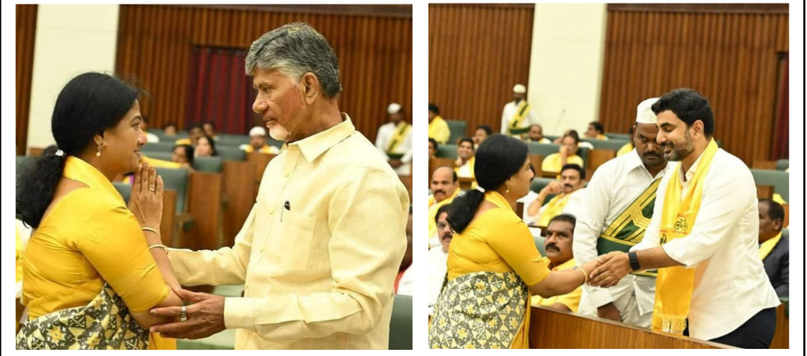
నవతరం - పలాస

టీడీపీ రాష్ట్ర ప్రధాన కార్యదర్శిగా నియామకం