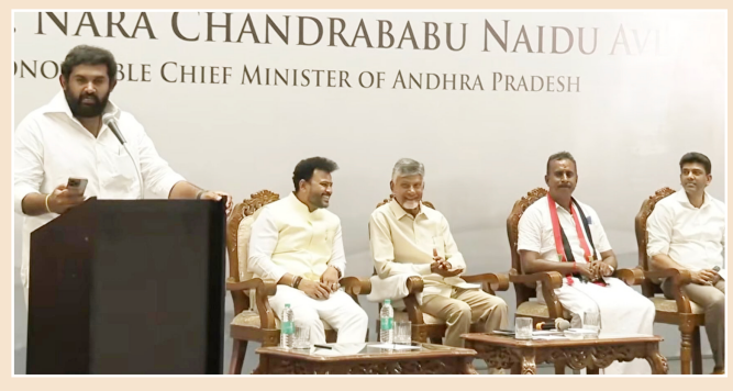
సవతరం - తమిళనాడు తమిళనాడులోని కోయంబత్తూరులో ఎన్టీఏ అభ్యర్థుల తరఫున నిర్వహించిన ఎన్నికల ప్రచారంలో కేంద్ర పౌర -మిగతా 2లో