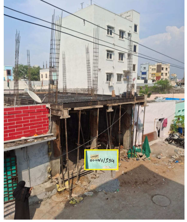
దేవేందర్ నగర్ బంద సవాజ్ మజిద్ సమీపంలో జీరో అనుమతుల నిర్మాణం