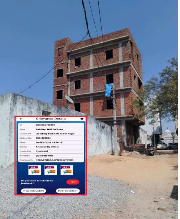
కైసర్ నగర్లో జీరో అనుమతుల భవన నిర్మాణం

డిమాండ్ చేస్తున్నారు. అదేవిధంగా మున్సిపల్ చట్టాలకు విరుద్ధంగా చేపట్టిన సదరు అక్రమ నిర్మాణాన్ని సీజ్ చేయాలని స్థానిక ప్రజలు కోరుకుంటున్నారు. ఇంతలా, టౌన్ ప్లానింగ్, మున్సిపల్ చట్టాలకు తూట్లు పొడుస్తున్న అక్రమనిర్మాణాలపై స్థానిక టౌన్ ప్లానింగ్ అధికారులు, కుత్బుల్లాపూర్ జోన్ కమిషనర్ ఎందుకు మానంగా ఉంటున్నారని మండిపడుతున్నారు ఇక్కడి జనం. ఇకనైనా సైబరాబాద్ మున్సిపల్ కమిషనర్ స్పందించి, అవినీతి కూపంలో కూరుకుపోయిన లంచగండి అధికారులపై శాఖాపరమైన చర్యలు తీసుకుని, అక్రమ నిర్మాణాలను నేలమట్టం చేయాలని డిమాండ్ చేస్తున్నారు ఫిర్యాదుదారులు.