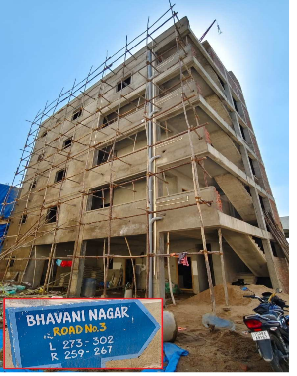
గాజులరామారం విలేజ్ భవాని నగర్ 262 లో బహుళ అంతస్తుల అక్రమ నిర్మాణం