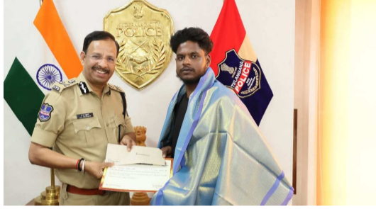
హైదరాబాద్, నవతరం తొమ్మిదేళ్ల బాలికను కాపాడిన ముగ్గురు సామాన్య పౌరులను హైదరాబాద్ పోలీస్ మిగతా 2లో సెటిల్