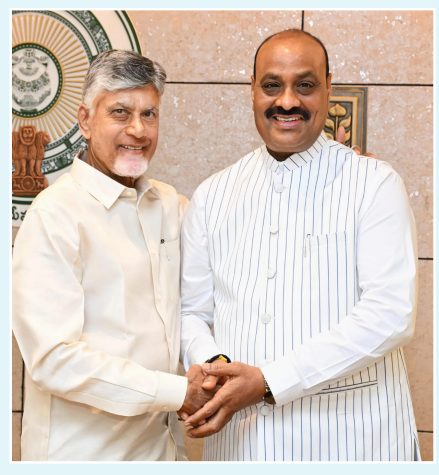
కట్టుబాటుతో ముందుకు సాగుతున్న మంత్రి అచ్చెన్నాయుడి పనితీరును సీఎం ప్రత్యేకంగా అభినందించారు. మంత్రి అచ్చెన్నాయుడు నాయకత్వంలో వ్యవసాయ, అనుబంధ శాఖల పరిపాలన మరింత సమర్థవంతంగా మారుతోందని, ప్రజలకు వేగవంతమైన సేవలు అందించాలనే ప్రభుత్వ సంకల్పాన్ని ఆయన కార్యచరణ సృష్టించిన ప్రతిబింబిస్తోందని అధికారులు పేర్కొన్నారు.

ఈ-ఫైళ్ల క్లియరెన్స్లో రాష్ట్ర వ్యవసాయ శాఖ మంత్రి కింజరాపు అచ్చెన్నాయుడు అసాధారణ వేగం ప్రదర్శిస్తూ పరిపాలనలో కొత్త ప్రమాణాలను నెలకొల్పుతున్నారు. ప్రజలకు వేగవంతమైన సేవలు అందించాలనే లక్ష్యంతో ఆయన తీసుకుంటున్న చర్యలు ప్రభుత్వ యంత్రాంగంలో చురుకుదనాన్ని పెంచుతున్నాయి. గతంలో ఈ-ఫైళ్ల క్లియరెన్స్కు సుమారు 5 గంటల సమయం తీసుకున్న మంత్రి అచ్చెన్నాయుడు, ప్రస్తుతం భారీ స్థాయిలో ఫైళ్లు వచ్చినప్పటికీ సరాసరి కేవలం 2 గంటల 49 నిమిషాల వ్యవధిలోనే ఫైళ్లను డిస్పోజ్ చేస్తుండటం పరిపాలనా సామర్థ్యానికి నిదర్శనమని అధికారులు వెల్లడించారు. ఈ-ఫైళ్ల క్లియరెన్స్ను రోజూ వ్యవధి నుంచి గంటల వ్యవధిలోకి తీసుకురావడంపై ముఖ్యమంత్రి నారా చంద్రబాబు నాయుడు సంతోషిస్తూ ప్రశంసలు తెలిపారు. పరిపాలనలో వేగం, పారదర్శకత, ప్రజా ప్రయోజనాల పట్ల