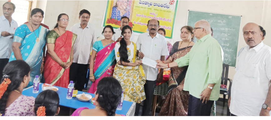
10వ తరగతి పబ్లిక్ పరీక్షల్లో అత్యుత్తమ ప్రతిభ కనబరిచిన విద్యార్థులకు 'కాంతి రేఖ అవార్డ్స్'