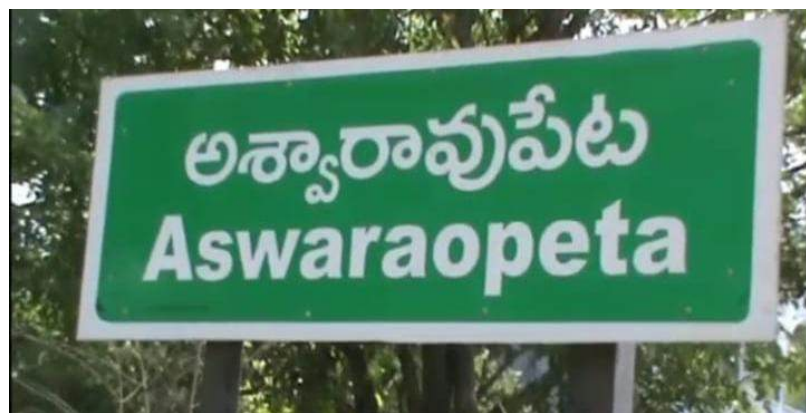
నవతరం ప్రతినది: ఖమ్మం/భద్రాద్రి కొత్తగూడెం జిల్లా

పూర్తి నిజాలు తెల్పాల్సిన బాధ్యత ఉన్నతాధికారులదే