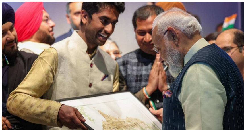
న్యూఢిల్లీ, నవతరం సెమికండక్టర్ల విషయంలో భారత్ కీలక ముందడుగు వేసిందని ప్రధానమంత్రి నరేంద్ర మోదీ అన్నారు. భారతదేశం అభివృద్ధిలో

దూసుకెళ్తోందని ప్రధాన మంత్రి నరేంద్ర మోదీ అన్నారు. డిజిటల్ చెల్లింపుల్లో ప్రపంచంలోనే భారత్ అగ్రస్థానంలో ఉందని చెప్పారు. దేశంలో ప్రస్తుతం నెలకు 20 బిలియన్ డాలర్ల డిజిటల్ ట్రాన్సాక్షన్లు జరుగుతున్నాయని తెలిపారు. భారత్ లో ఒకప్పుడు కేవలం 4 యూనికార్డ్ సంస్థలే ఉండేవని.. ప్రస్తుతం అవి 100కు చేరాయన్నారు. సెమికండక్టర్ల అంశంలోనూ భారత్ ముందడుగు వేసిందని.. ఆ దిశగా పనులు కూడా జరుగుతున్నాయని పేర్కొన్నారు. నెదర్లాండ్స్ పర్యటనలో ఉన్న ప్రధాని నరేంద్ర మోదీ.. ది హేగ్ నగరంలో ప్రవాస భారతీయులను కలిశారు. వారితో మాటామంతి కార్యక్రమం నిర్వహించారు. ఈ సందర్భంగా ఎన్ఆర్ఐలపై ప్రశంసలు కురిపించారు. లక్ష్యాలను అధిగమించి వారు పని చేస్తున్నారని కొనియాడారు. ఈ సందర్భంగా సాంస్కృతిక కార్యక్రమాలతో ప్రధానికి ఘనస్వాగతం లభించింది. ప్రవాస భారతీయులతో కరచాలనం, మాటామంతి నిర్వహించారు. నెదర్లాండ్స్ నాయకత్వంతో ఎప్పుడు మాట్లాడినా ప్రవాస భారతీయులను