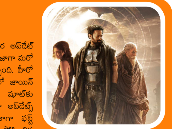
నటీనటులు సీక్వెల్ లో కనిపించబోతున్నట్లు తెలుస్తుండగా.. మేకర్స్ నుంచి అవ్వడే రావాల్సి ఉంది.

ప్రభాస్ అభిమానులతో, సైన్స్ ఫిక్షన్ షో-నర్ సినిమాలను ఇప్పడే ప్రేక్షకులు ఆసక్తిగా ఎదురుచూస్తున్న ప్రాజెక్టుల్లో ఒకటి 'కల్కీ 2898 -2' ప్రాంచైజీ. ఇప్పటికే ఫస్ట్ పార్ట్ తో బాక్సాఫీస్ ను షేక్ చేసిన ప్రభాస్-నాగ్ అశ్విన్ టీం ఇక సీక్వెల్ తో ఎంటర్టైన్ చేసేందుకు రెడీ అవుతున్నారని తెలిసింది. అయితే సీక్వెల్ ఎప్పుడు సెట్స్ పైకి వెళ్లనుమతి పాత్ర కోసం సీక్వెల్ లో ఇంకా ఏ షూటింగ్ లో పాటూ పలువురు కీలక