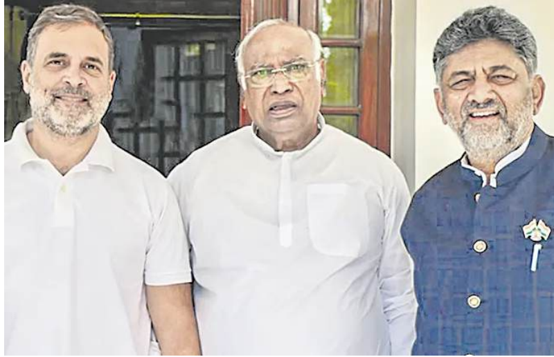
నియమిస్తూ ఏజెన్సీ అధ్యక్షుడు మల్లికార్జున ఖర్గే నిర్ణయం తీసుకున్నారు. రాష్ట్ర రాజకీయాల నుంచి పూర్తిగా తప్పుకోకుండా, జాతీయ రాజకీయాల్లోనూ ఆయన పాత్ర కొనసాగించాలనే సంకేతంగా ఈ నిర్ణయాన్ని పార్టీ వర్గాలు భావిస్తున్నాయి.

అధికార మార్పిడికి సమాంతరంగా సిద్ధరామయ్యకు జాతీయ స్థాయిలో గౌరవప్రదమైన బాధ్యత అప్పగించారు. కాంగ్రెస్ వర్గం కమిటీ (సీడబ్ల్యూసీ) సభ్యుడిగా ఆయనను