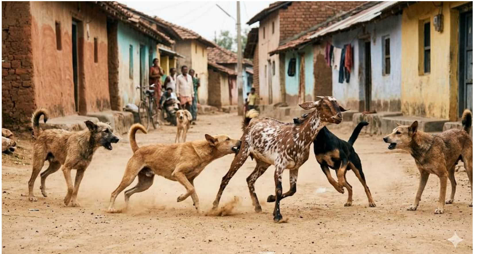
నవతరం ప్రతినీధి, ఖమ్మం/ భద్రాద్రి కొత్తగూడెం జిల్లా

రోగగ్రస్తమైన లేదా చనిపోయిన మేకలు, గొర్రెల మాంసాన్ని వినియోగించడం వల్ల ఆహార విషబాధ, తీవ్రమైన వాంతులు, విరేచనాలు, కడుపునొప్పి, జ్వరం, పేగు సంబంధిత ఇన్ఫెక్షన్లు వచ్చే ప్రమాదం ఉందని వైద్య నిపుణులు హెచ్చరిస్తున్నారు. సాల్మోనెల్లా, ఈ-కోలై వంటి హానికర బ్యాక్టీరియా శరీరంలోకి ప్రవేశించి తీవ్రమైన ఆరోగ్య సమస్యలకు దారితీయవచ్చు. ముఖ్యంగా చిన్నపిల్లలు, గర్భిణీలు, వృద్ధులు, రోగనిరోధక శక్తి తక్కువగా ఉన్నవారిపై ఇటువంటి కలుషిత మాంసం ప్రభావం మరింత తీవ్రంగా ఉండే అవకాశం ఉంది. అందుకే పశువైద్య పరీక్షలు పూర్తయిన, అధికారికంగా ధృవీకరించబడిన మాంసాన్ని మాత్రమే కొనుగోలు చేయాలని నిపుణులు సూచిస్తున్నారు.